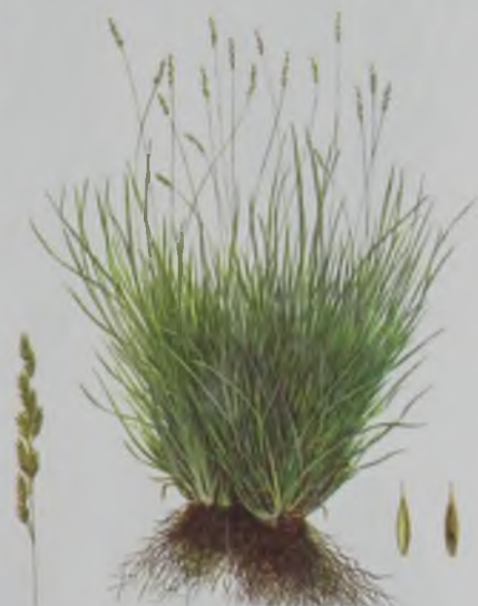
Рис. 81. Овсяница валисская, типчак – кәдімгі бетеге.