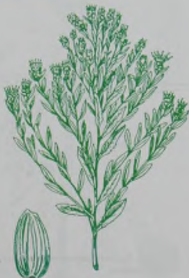
Рис. 128. Горчак южный – оңтүстік үкекіре.