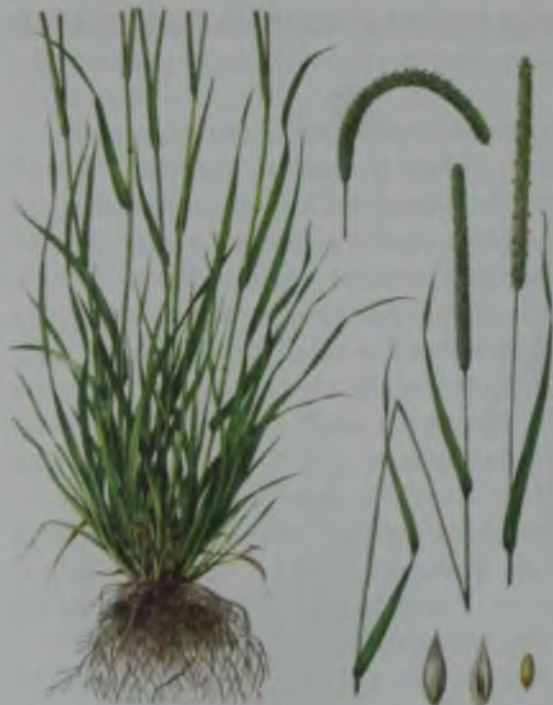
Рис. 83. Тимофеевка степная – дала атқонақ.