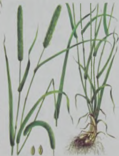
Рис. 49. Тимофеевка луговая – шалғын атқонақ.