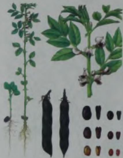
Рис. 18. Бобы кормовые – Мал азықтық бұршақ.