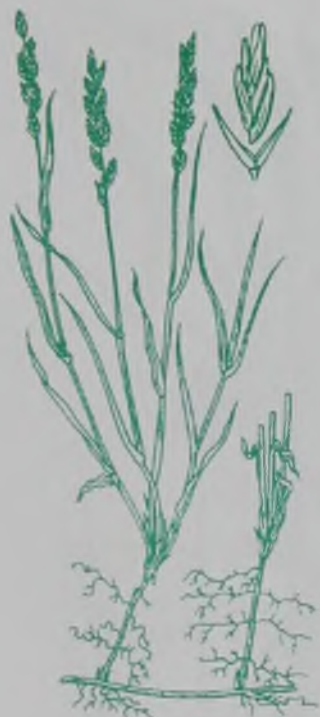
Рис. 99. Колосняк ветвистый – Бутақты қияқ.