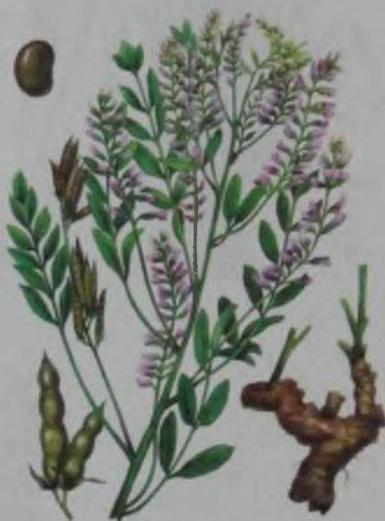
Рис. 88. Солodka голая – жалаң мия.