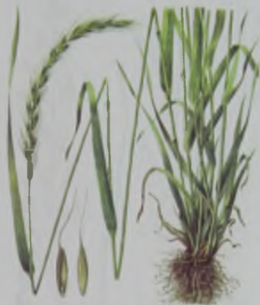
Рис. 41. Пырейник (клинэлимус) сибирский (волоснец сибирский) – сибір қияқ.