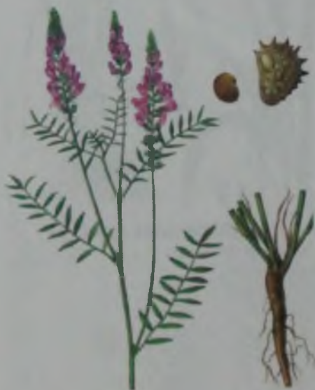
Рис. 53. Эспарцет песчаный – құм эспарцеті.