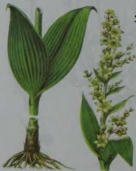
Рис. 139. Чемерица Лобеля – Лобель марал құрай.