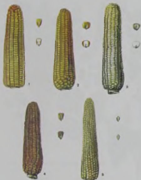
Рис. 7. Виды кукурузы