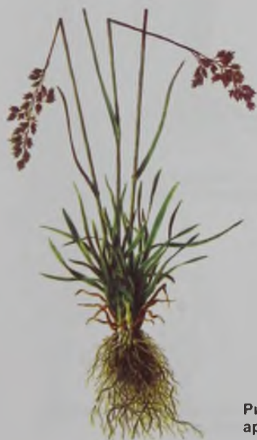
Рис. 101. Мятлик альпийский – арпа қоңырбас.