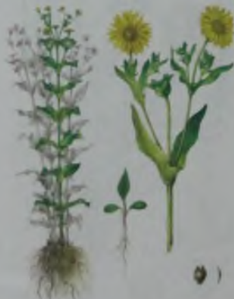
Рис. 67. Сильфия пронзеннолистная – суйр жапыракты сильфия.