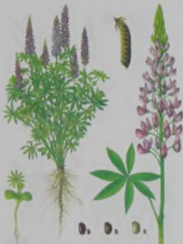
Рис.21. Люпин многолетний – жапырақты бері бұршақ.