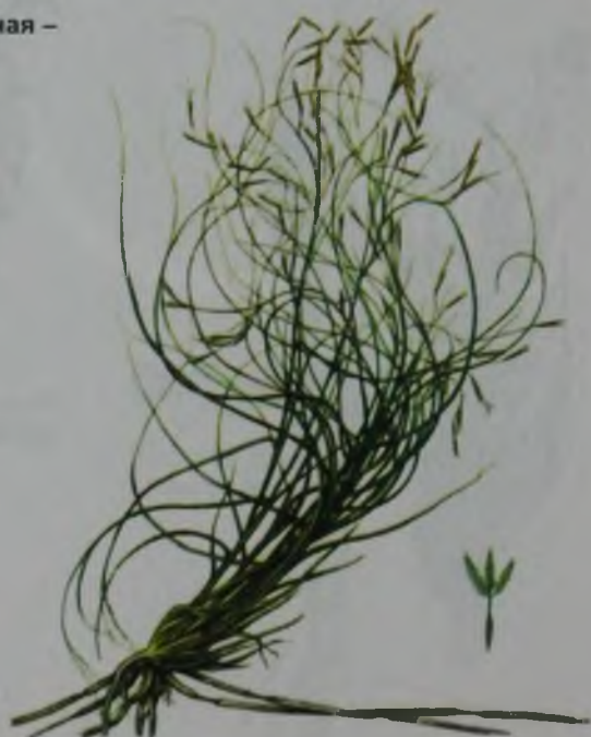
Рис. 154. Селин перистый, паутинистый – ақ селеу, түкті селеу.