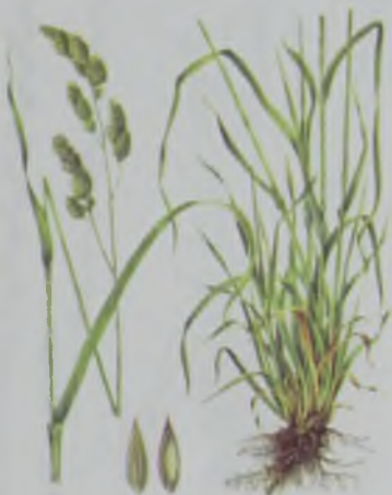
Рис. 42. Ежа сборная – кәдімгі тарғақшөп.