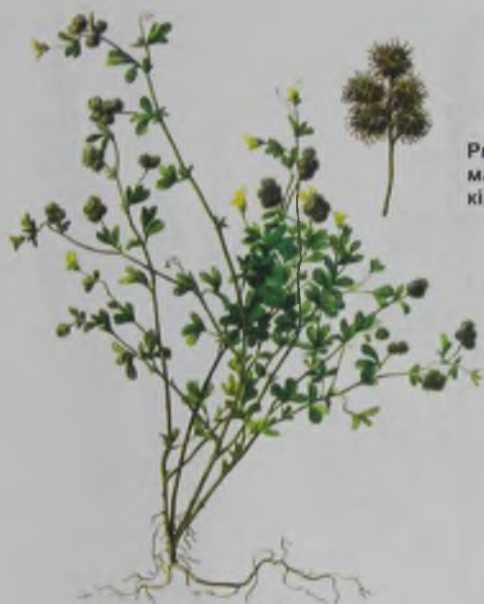
Рис. 131. Люцерна маленькая – кіші жоңышқа.