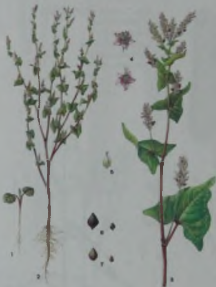
Рис. 10. Гречиха – қара құмық.