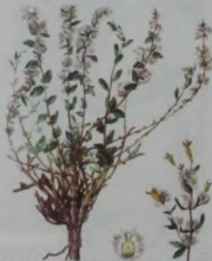
Рис. 61. Терескен серый – теріскен.