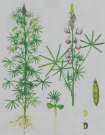
Рис.22. Люпин синий (узколиственный) – көк бері бұршақ.