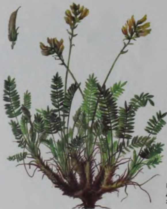
Рис. 97. Остролодочник джунгарский – жоңғар кекре.