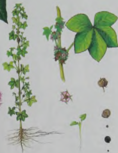
Рис. 69. Мальва курчавая – құлқайыр (тумагүл).