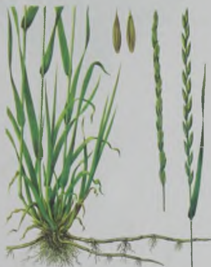
Рис. 91. Пырей (ползучий)- шероховатый-стебельный (ползучий) – жатаған бидайық.