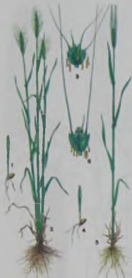
Рис. 1. Пшеница – бидай. 1,2,3 – мягкая: растения в фазах всходов и цветения; 4,5,6 – твердая, то же;