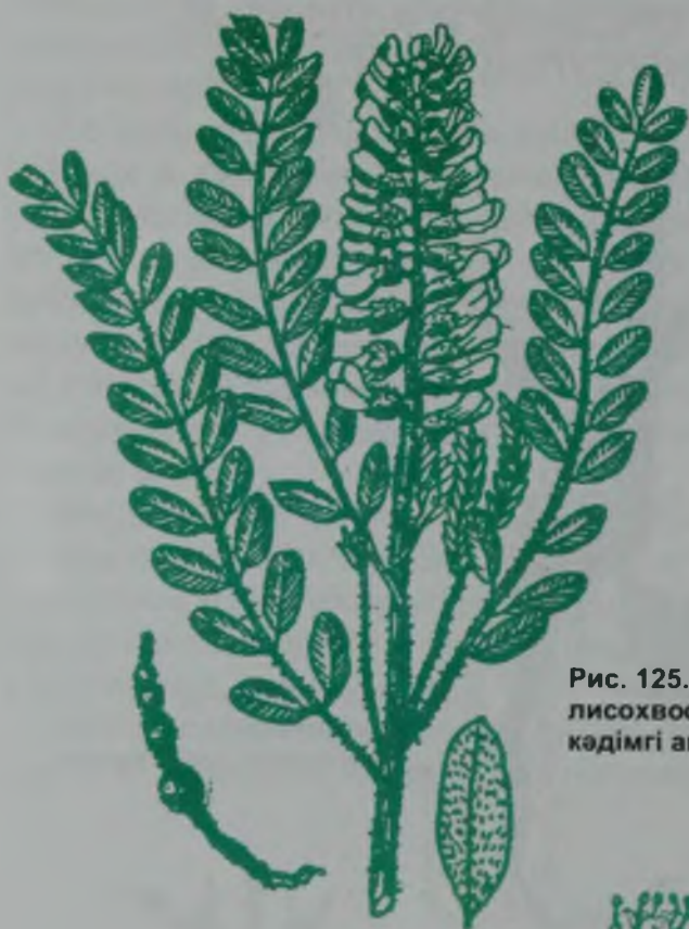
Рис. 125. Брунец (софора) лисохвостный – кәдімгі ақмия.