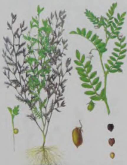
Рис. 17. Нут – ноқат.