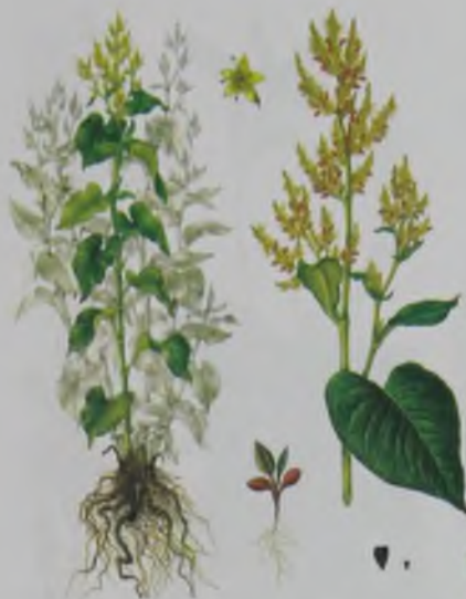
Рис. 68. Горец Вейриха – Вейрих тараны.