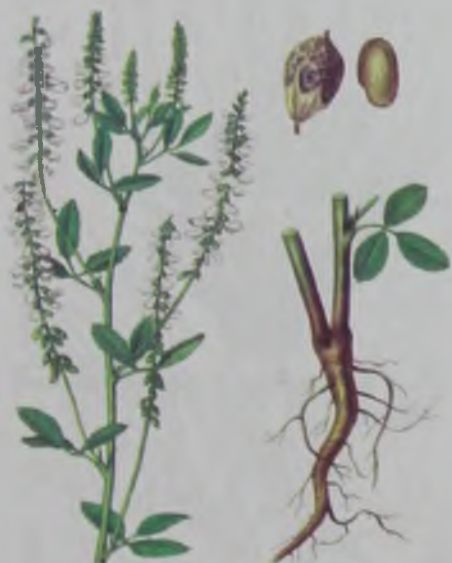
Рис. 57. Донник белый – ақ түйе жоңышқа.