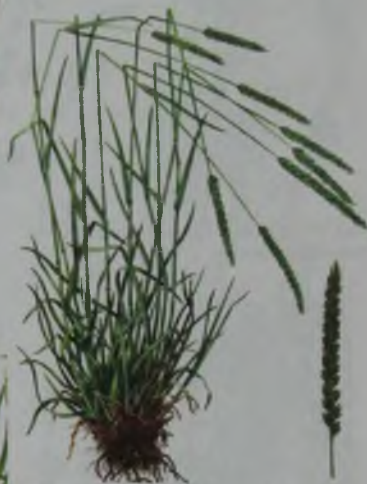
Рис. 121. Ячмень короткоостый – тау арпа.