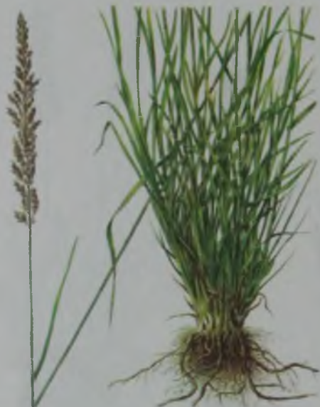
Рис. 114. Вейник наземный – құрғақ айрауық.