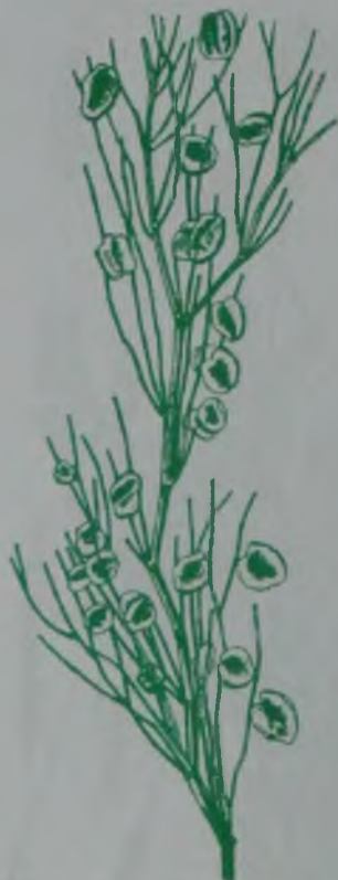
Рис. 102. Жузгун безлистный – қызыл жүзгін.