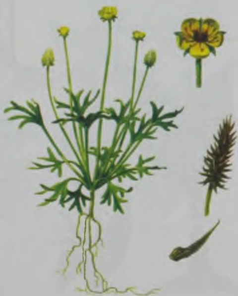
Рис. 136. Рогоглавник серповидный – мүйізді шенгебас.