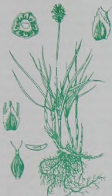
Рис. 117. Осока толстолобиковая – толық қияқелең.