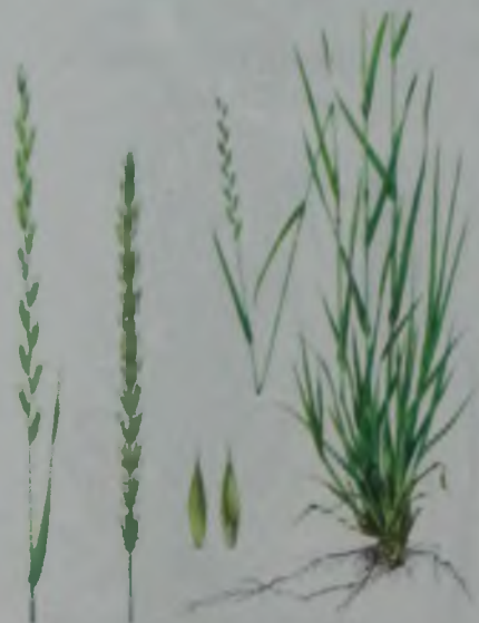
Рис. 39. Пырейник шероховатостебельный, бескорневищный – жатаған бидайық.