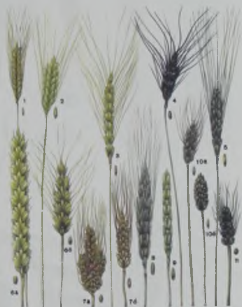
Рис. 2. Виды пшеницы 1–культурная однозернянка; 2–Тимофеева; 3 – полба; 4–персидская; 5–твердая; 6–мягкая: а–безостая; б–остистая; 7–тургимуд: а–ветвистоколосая; б–обычная; 8–польская; 9–слельта; 10–карликовая: а–остистая; б–безостая; 11–круглозерная.