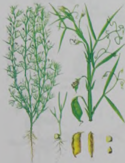
Рис. 16. Чина посевная – шалгелі бұршақ.