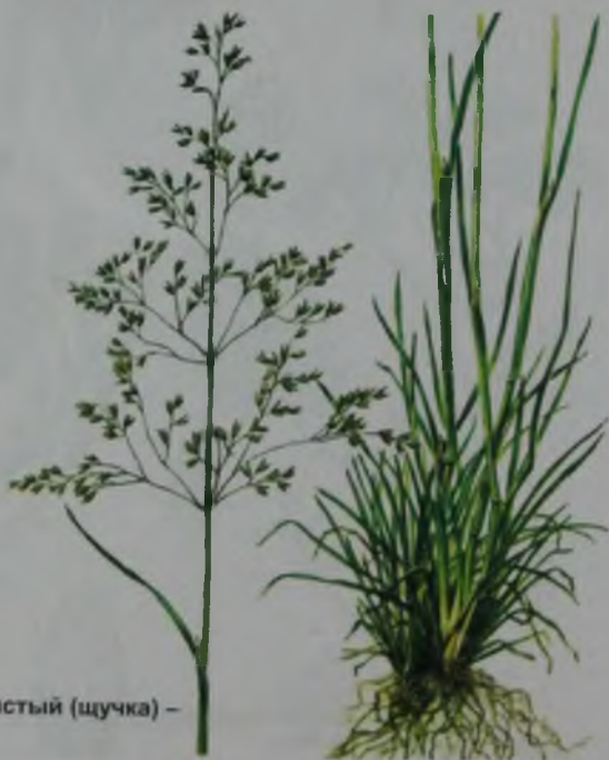
Рис. 130. Луговик дернистый (щучка) – кеде селдірек.