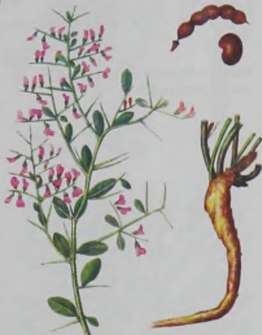
Рис. 112. Верблюжья колючка ложная – кәдімгі жантақ.