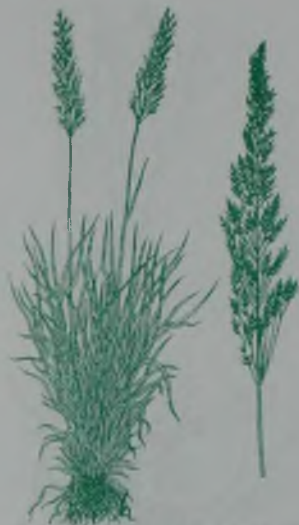
Рис. 108. Чий блестящий – ақ ший.