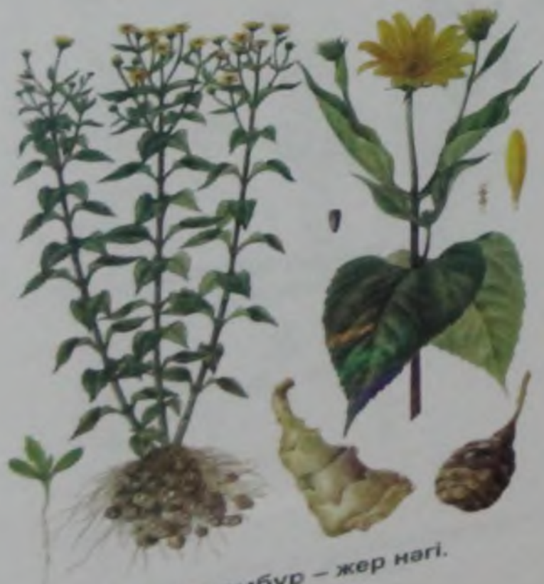
Рис. 73. Топинамбур – жер нагі.