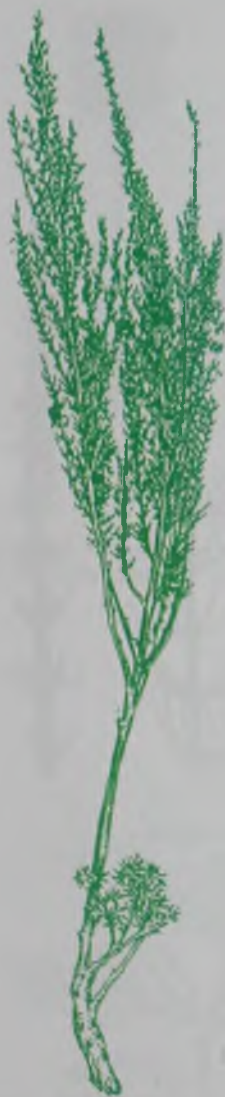
Рис. 135. Полынь эстрагон – шыралжын жусак.