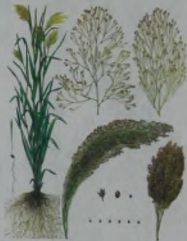
Рис. 31. Просо – тары.