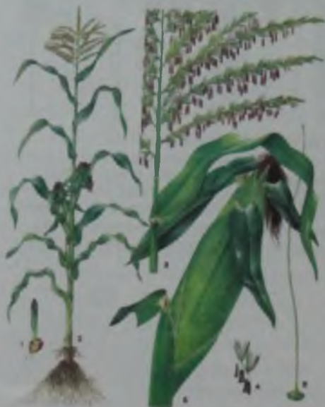
Рис. 6. Кукуруза – жүгері.