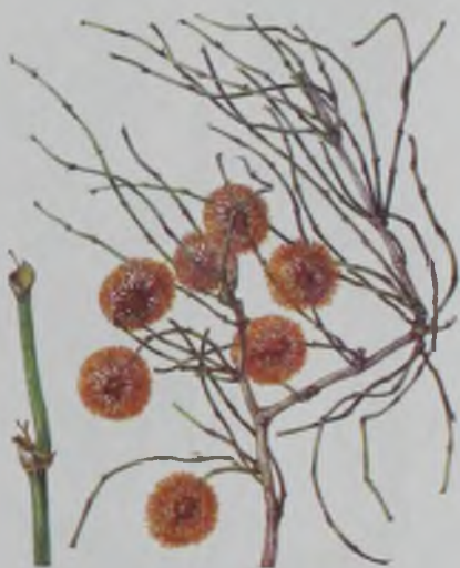
Рис. 106. Жузгун голова медузы – медуза жүзгін.