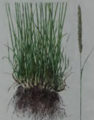
Рис. 109. Тонконог гребенчатый – қоңырбас желлерия.