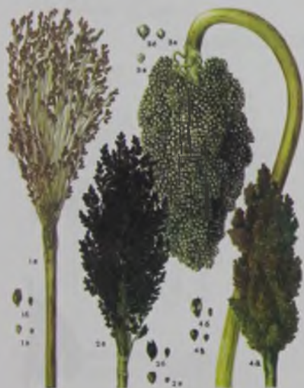
Рис. 9. Виды сорго.