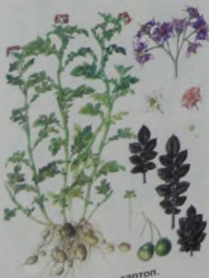
Рис. 79. Картофель – картоп.