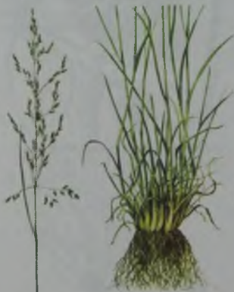
Рис. 110. Бескильница расставленная – батыраңқы ақмамық.