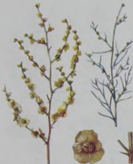
Рис. 62. Солянка малолистная (чогон).