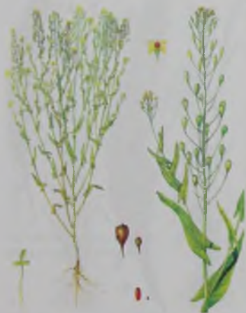
Рис. 29. Рыжик – арыш.