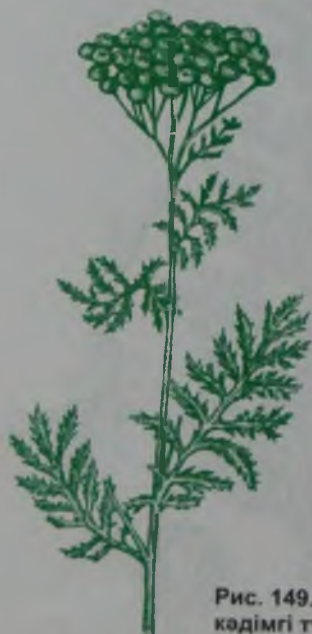
Рис. 149. Пижма обыкновенная – кәдімгі түймешетен.