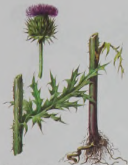
Рис. 140. Чертополох поникающий – еңкіш түйетікен.