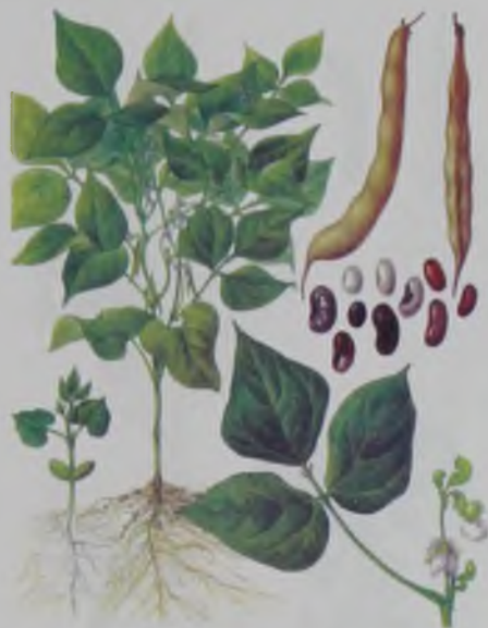
Рис. 14. Фасоль – үрме бұршақ.