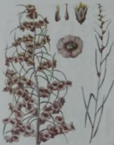
Рис. 65. Солянка Рихтера (через).