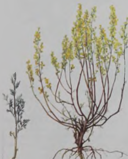
Рис. 92. Пoлынь малоцветковая, черная – қара жусан