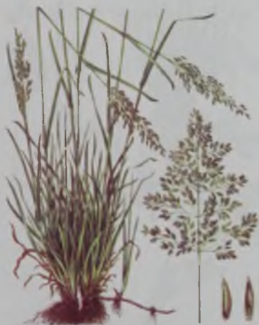
Рис. 43. Мятлик луговой – шалғын қоңырбас.