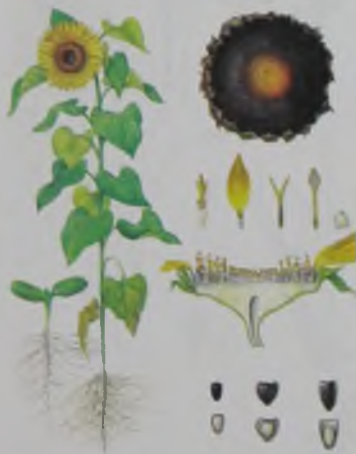
Рис.23. Подсолнечник – күнбағыс.