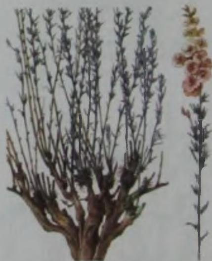
Рис. 60. Солянка корявая (кейреук) – күйреук.