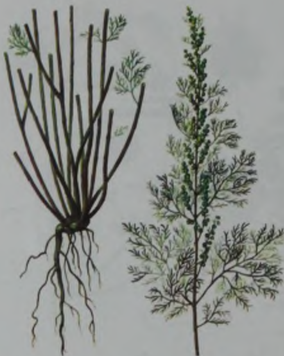
Рис. 133. Полынь высокая – бік жусан