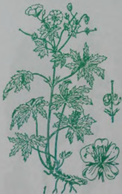
Рис. 89. Герань холмовая – деңшіл қазтамақ.