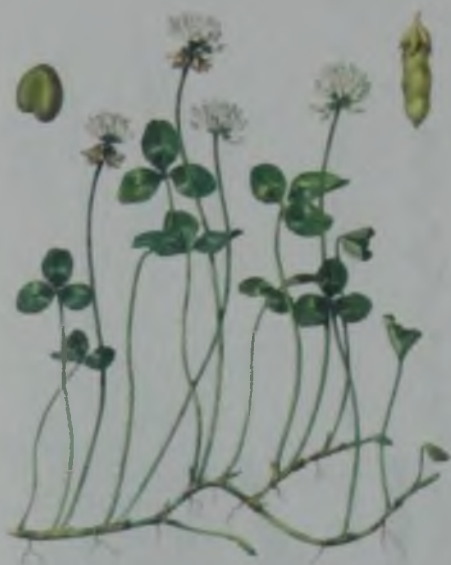
Рис. 51. Клевер белый – ақ беде.