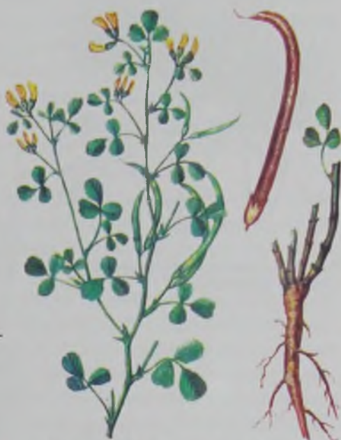
Рис. 118. Пажитник дугообразный – имек бойдана.