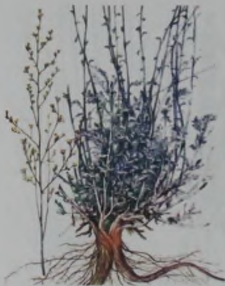
Рис. 87. Полынь белоземельная – тамыр жусан.