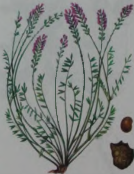
Рис. 54. Эспарцет закавказский – кавказ эспарцеті.