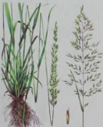
Рис. 44. Райграс высокий – биік үйбидайық.