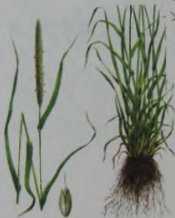
Рис. 122. Лисохвост луговой – шалғын түлкіқұйрық.