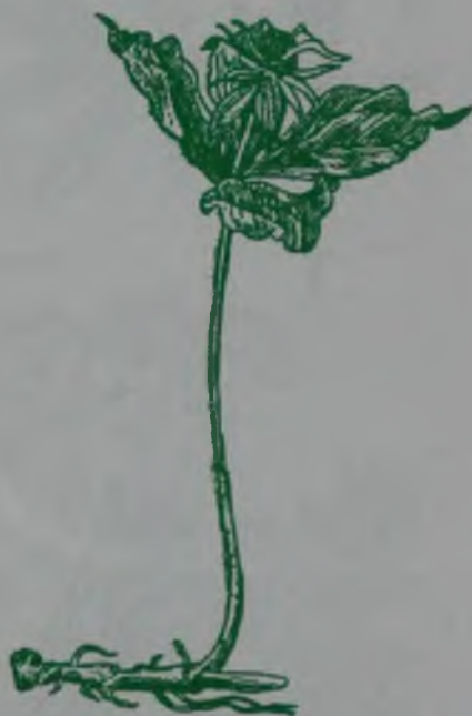
Рис. 148. Вороний глаз – кәдімгі қарға көз.