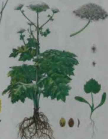
Рис. 66. Борщевик Сосновского – аю балдырганы.