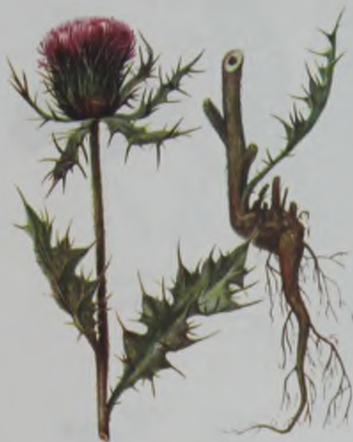
Рис. 123. Бодяк щетинистый – қылшықты сары қаулек