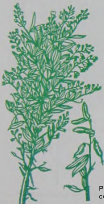
Рис. 107. Песчаная акация серебристая – күміс қоян сүйек.