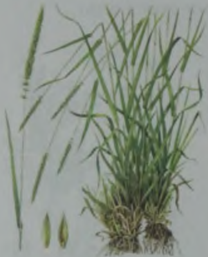
Рис. 37. Житняк сибирский (узкоколосый) – жол еркек, шөл бидайық.