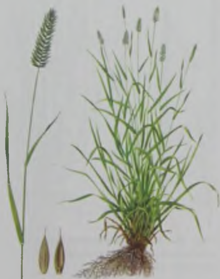
Рис. 36. Житняк гребневидный тарақ бидайық.