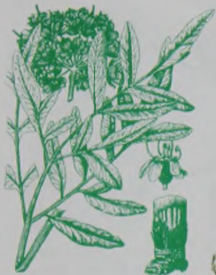
Рис. 150. Ферула вонючая – сасық курай сасыр.