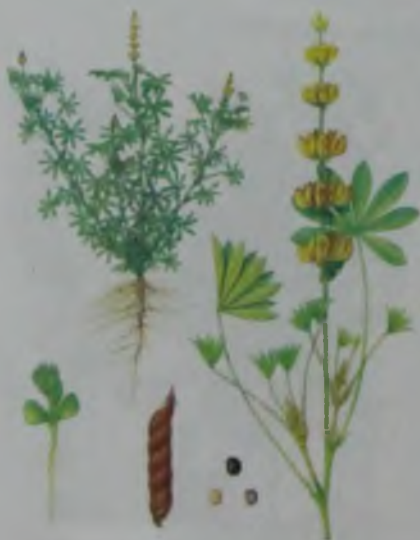
Рис. 20. Люпин желтый – сары бөрі бұршақ.