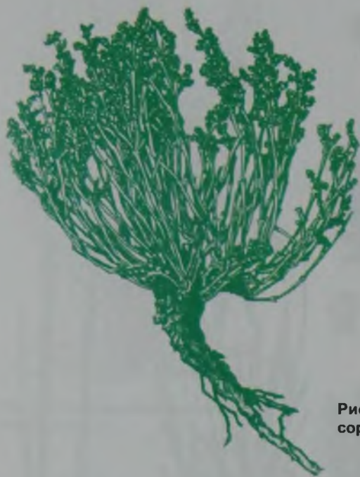
Рис. 93. Ежовник солончаковый – сортаң бұйырғын.