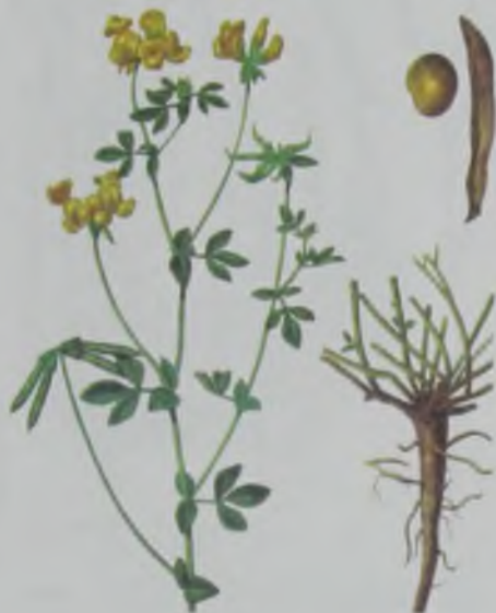
Рис. 56. Лядвенец рогатый – тікенді лотус.