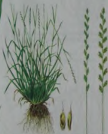
Рис. 46. Райграс многоукосный – көп гүлді үйбидайық.