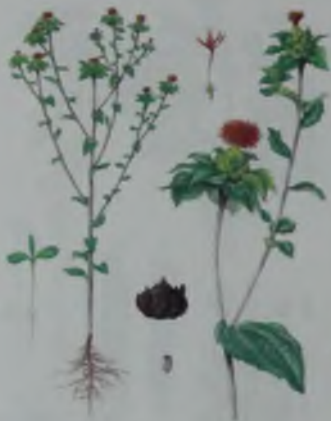
Рис. 24. Сафлор – мақсар.