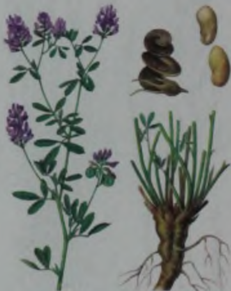
Рис. 52. Люцерна синяя – кәдімгі жоңышқа.