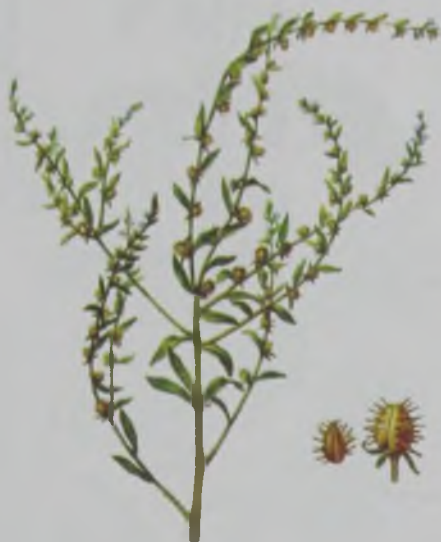
Рис. 151. Липучка ежевидная – кірпіше кәркіз.