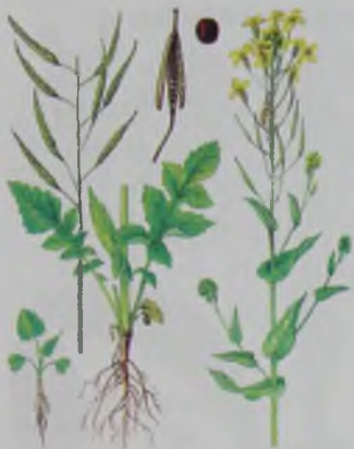
Рис. 27. Сурепица – сарбас.