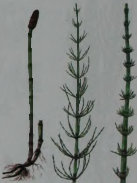
Рис. 138. Хвоц полевой – дала қырықбуын.