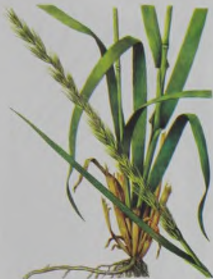
Рис. 105. Колосняк кистистый гигантский – айғыр қыяқ.