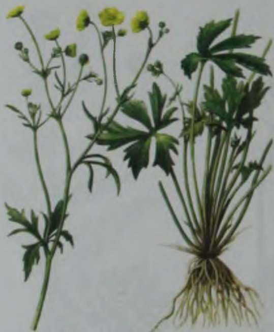
Рис. 143. Лютик жгучий – күйдіргі сарғалдақ.