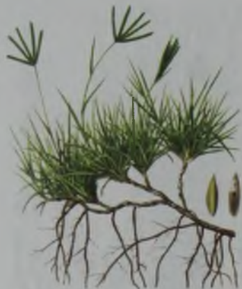
Рис. 120. Свиной палец – саламы қарашағыр.