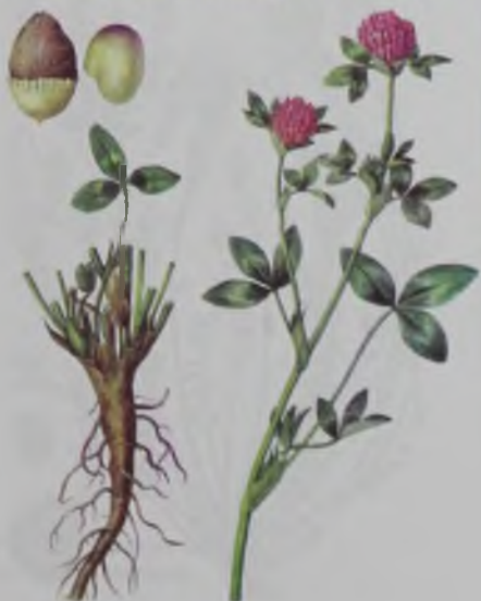
Рис. 50. Клевер красный – қызылбас беде.