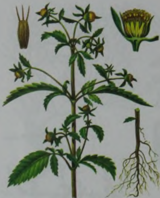
Рис. 153. Черда трехраздельная – үштармақ итошаған.