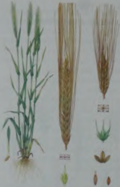
Рис. 4. Ячмень – арпа.