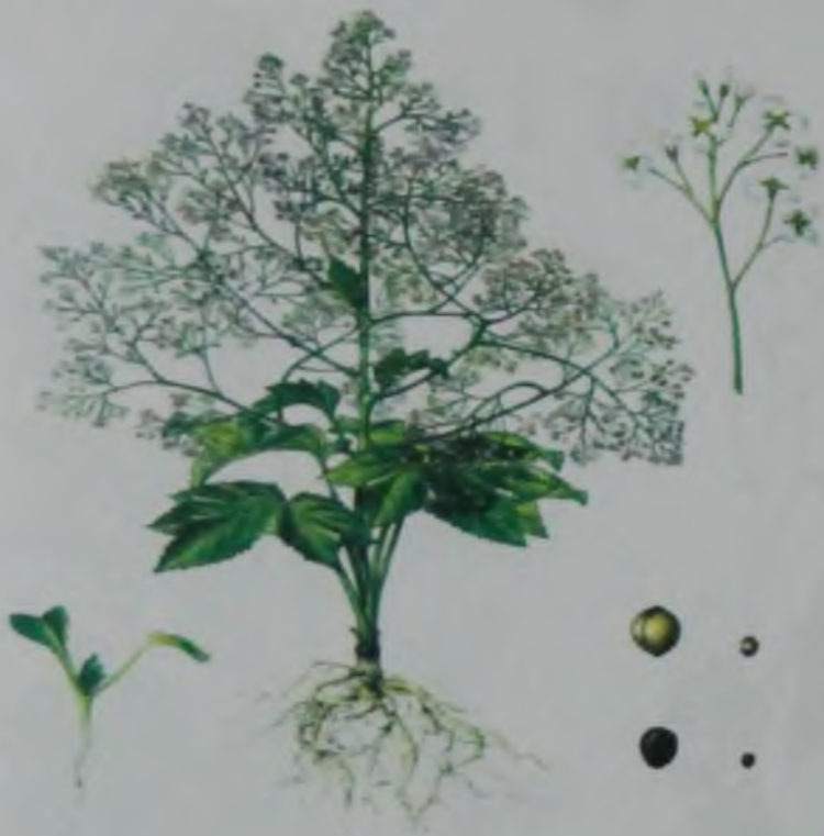
Рис. 71. Катран сердцелистный.