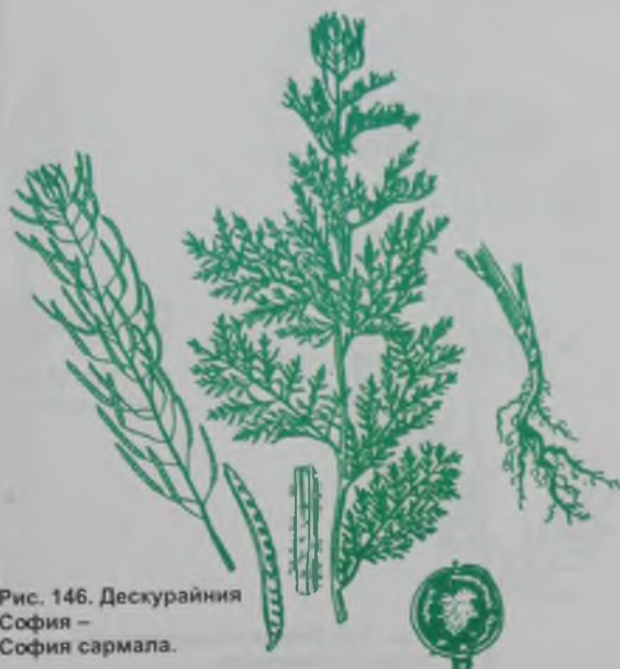
Рис. 146. Дескурайния София – София сармала.