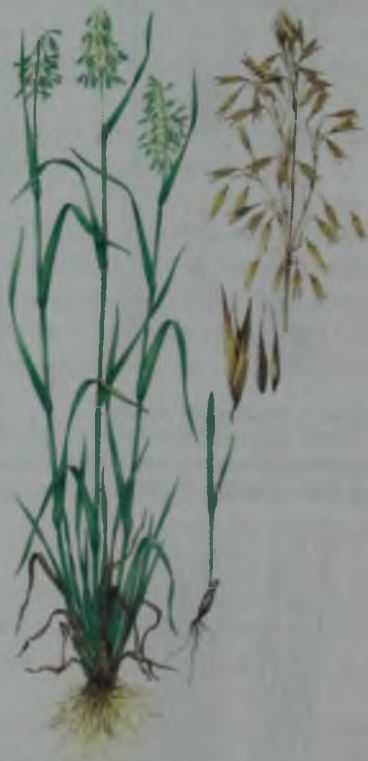
Рис. 5. Овес – сулы.