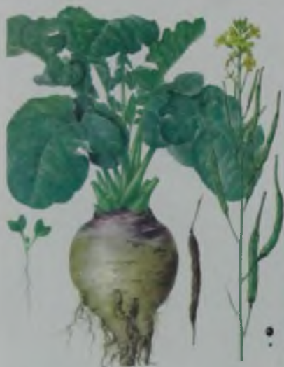
Рис. 77. Брюква – тарна (шалқанның бір түрі).