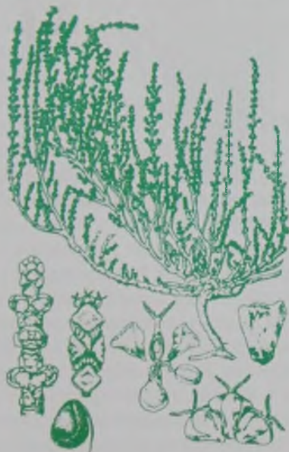
Рис. 119. Сарсазан шишковатый – төмпек сарсазан.