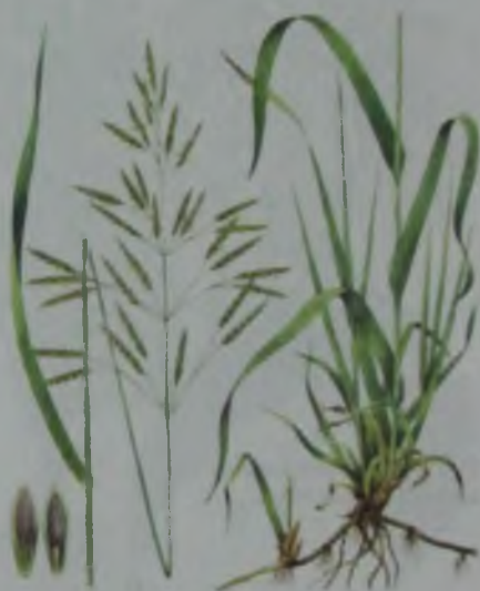
Рис. 38. Кострец безостый – қызыл от, қылтанақсыз арпабас.