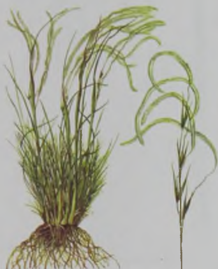
Рис. 80. Ковыль Лессинга – бетеге, бөз қау.