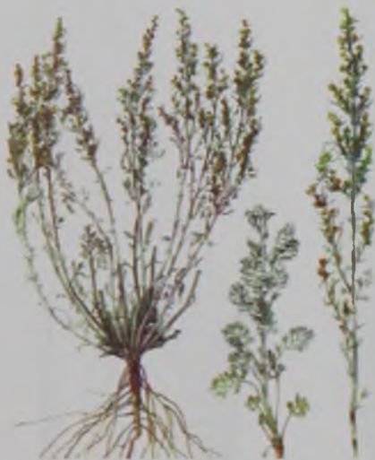
Рис. 82. Полынь Лерховская – ақ жусан