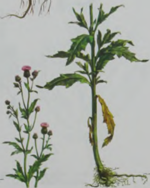
Рис. 124. Бодяк полевой – егістік сары қаулек