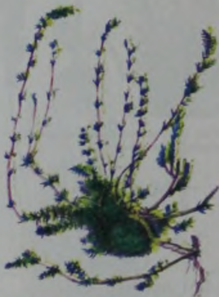
Рис. 115. Камфоросма марсельская – Марсель қараматау.