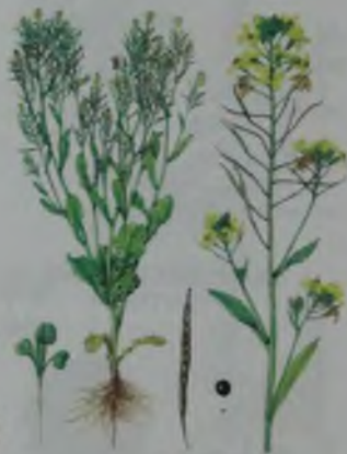
Рис. 25. Рәпс.