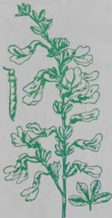
Рис. 113. Карагана кустарник – бұта қараған.