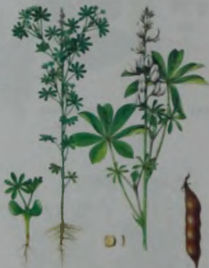
Рис. 19. Люпин белый – ақ бөрі бұршақ.