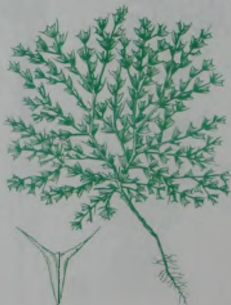
Рис. 116. Рогач песчаный – қум ебелек.