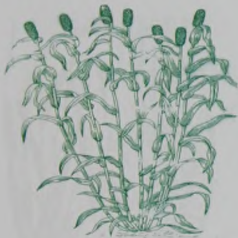
Рис. 33. Африканское просо – африкандық тары.