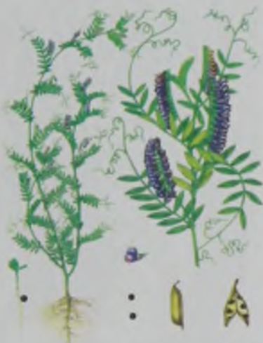
Рис. 34. Вика мохнатая – түкті сиыр жоңышқа