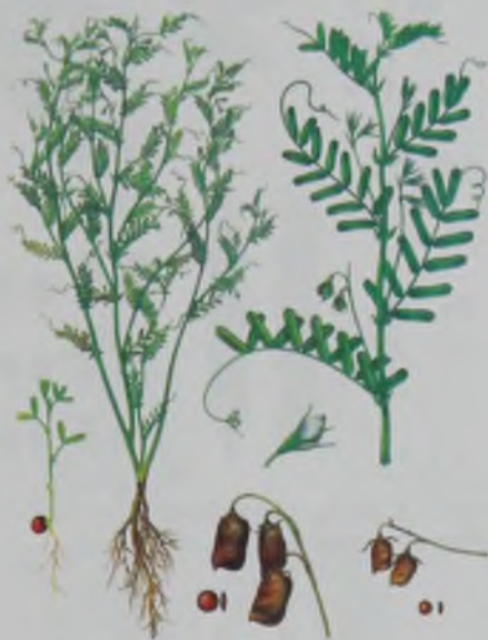
Рис. 15. Чечевица – жасамық.