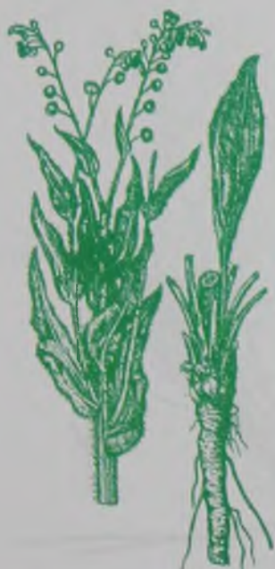
Рис. 152. Чернокорень лекарственный – дәрілік қаратамыр.