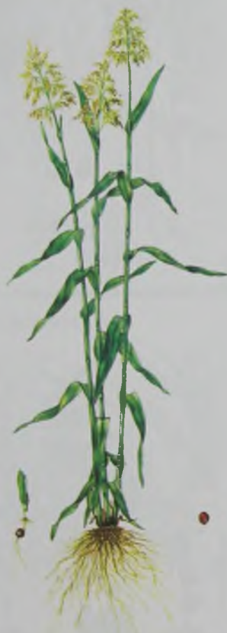
Рис. 8. Сорго – кәдімгі жүгері.