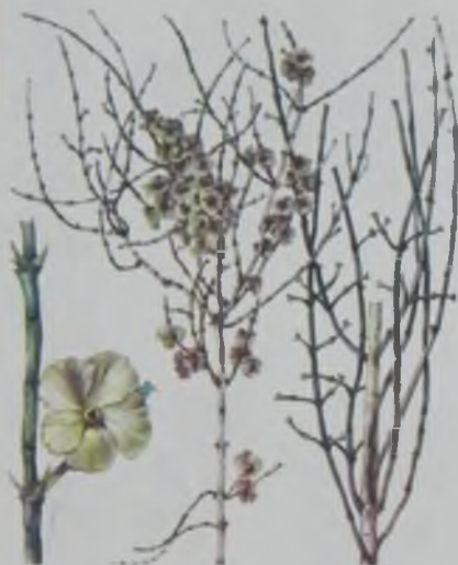
Рис. 63. Саксаул персидский (белый) – ақ сексеуіл .