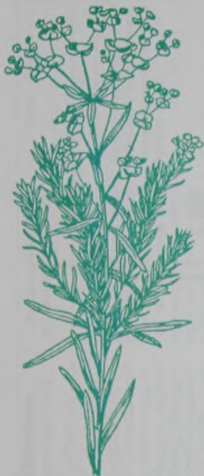
Рис. 155. Молочай солнечный – күншіл сүттіген.