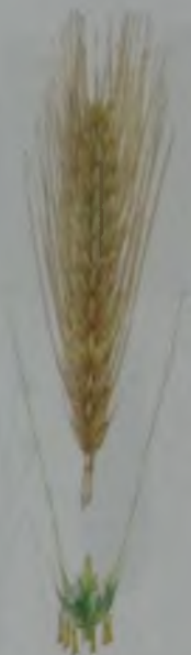
Рис. 11. Тритикале.