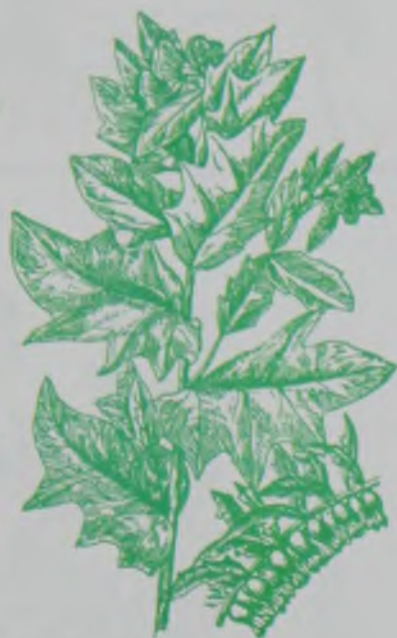
Рис. 141. Белена черная – қара меңдуана.