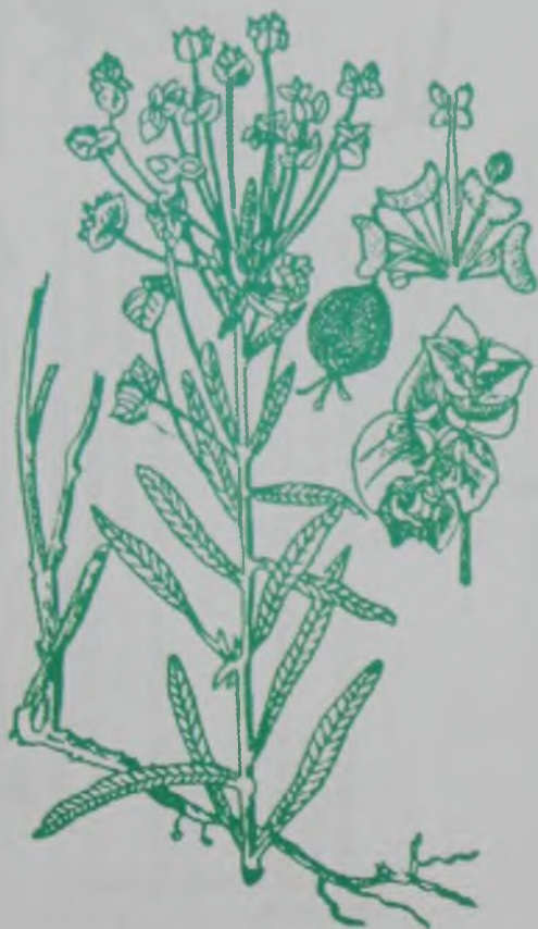
Рис. 156. Молочай лозный – шоғылы сүттіген.