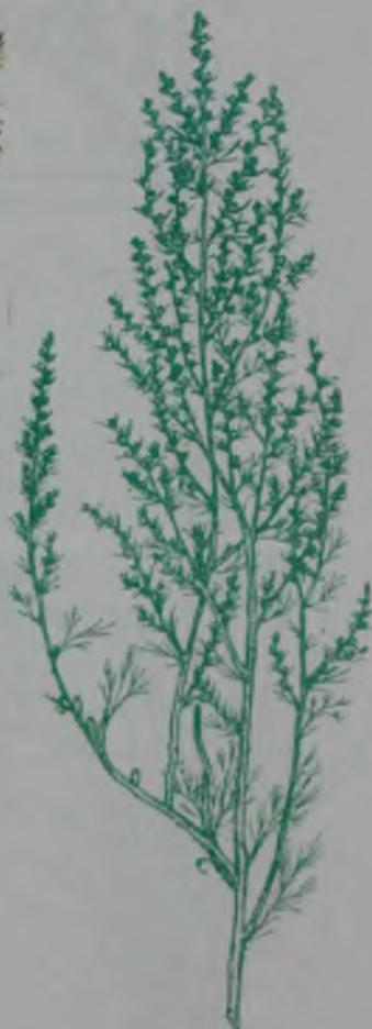
Рис. 134. Полынь таврическая – таврия жусан