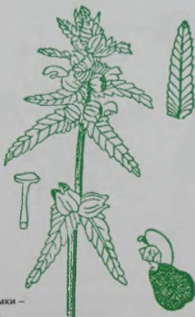
Рис. 132. Погремки – сылдырмақтар.