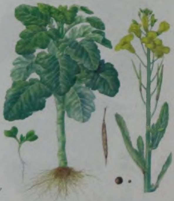
Рис. 72. Капуста кормовая – жапырақты капуста.