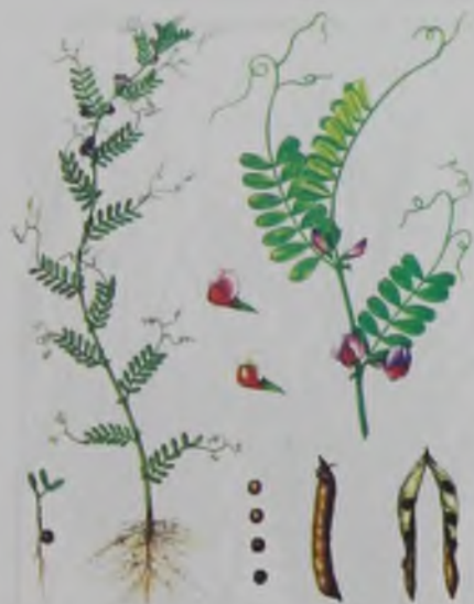
Рис. 35. Вика яровая – жаздық сиыр жоңышқа.