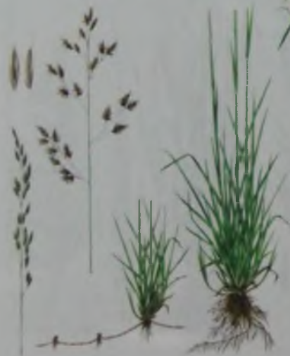
Рис. 47. Oвсяница красная – қызыл бетеге.