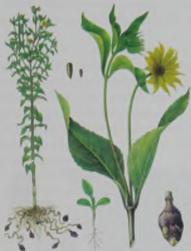
Рис. 74. Топинсолнечник – күн түйнегі.