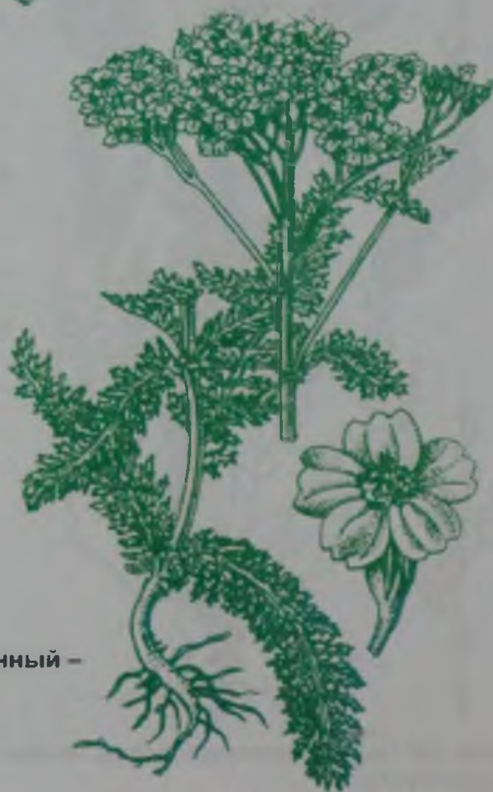
Рис. 94. Тысячелистник обыкновенный – кәдімгі мыңжапырақ.