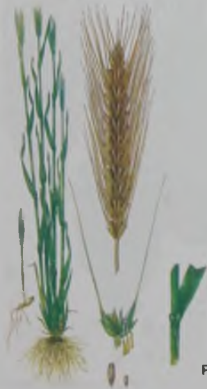
Рис. 3. Рожь – қара бидай.