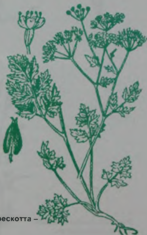
Рис. 126. Бутень Прескотта – Прескотт бутені.