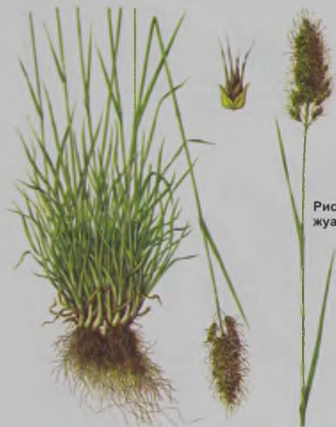
Рис. 95. Мятник луковичный – жуашықты қоңырбас.