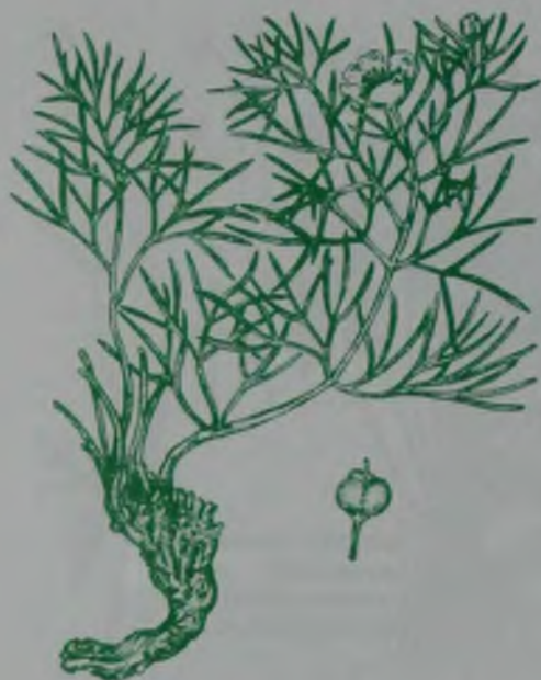
Рис. 147. Гармала обыкновенная – кәдімгі адыраспан.