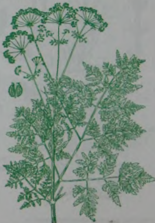
Рис. 144. Болиголов пятнистый – шұбар убалдырған