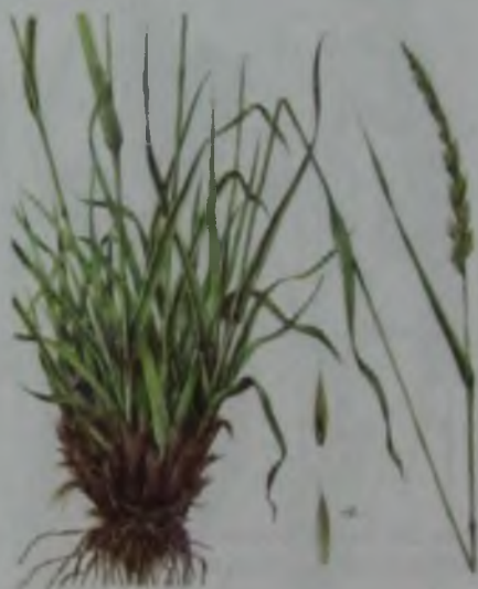
Рис. 40. Ломкоколосник ситниковый – тарлау, тарлан қияқ.