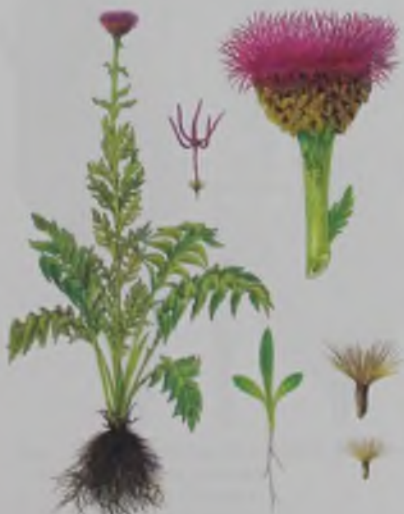
Рис. 70. Рапонтик сафлоровидный – мақсар ұқсас марал шөл тамыры.