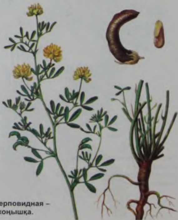
Рис. 98. Люцерна серповидная – (желтая) – сарбас жоңышқа.