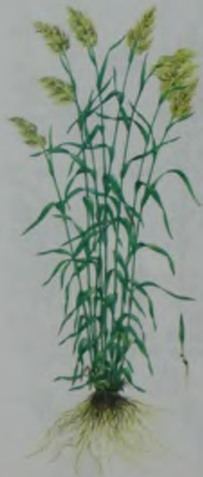
Рис. 30. Суданская трава – судан шеби.