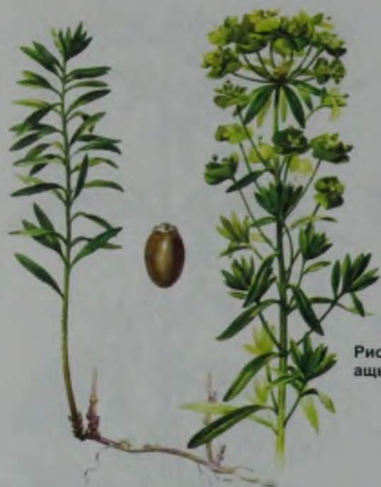
Рис. 157. Молочай острый – ащы сүттігек