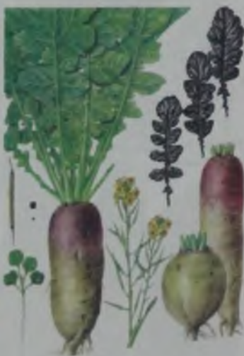
Рис. 78. Турпенс – шалқан