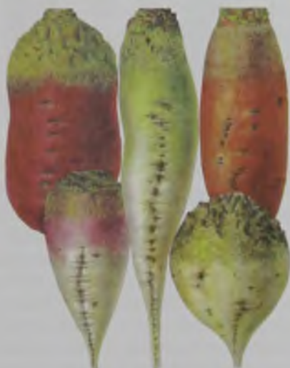
Рис. 76. Сорто типы кормовой свеклы 1-Эккендорфская красная; 2-Полусахарная красная; 3-Полусахарная белая; 4-Баррес; 5-Сахарная округлая.