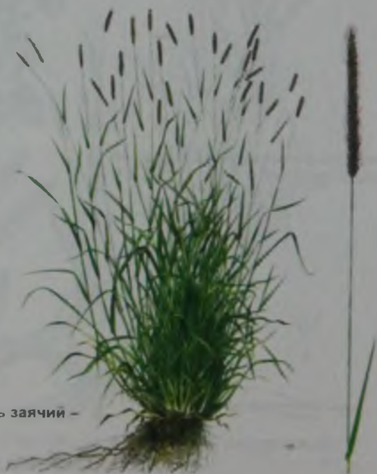
Рис. 158. Ячмень заячий – қоян арпа.