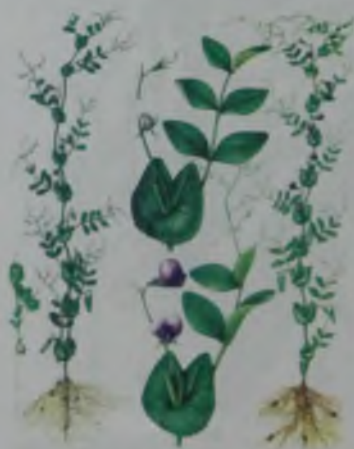
Рис. 12. Горох – бұршақ.