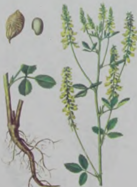
Рис. 58. Донник желтый – дәрі түйе жоңышқа.