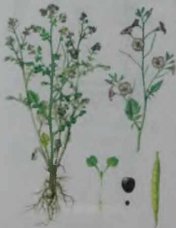
Рис. 26. Редька масличная – майлы шомыр.