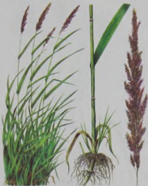
Рис. 111. Тростник обыкновенный – кәдімгі қамыс.