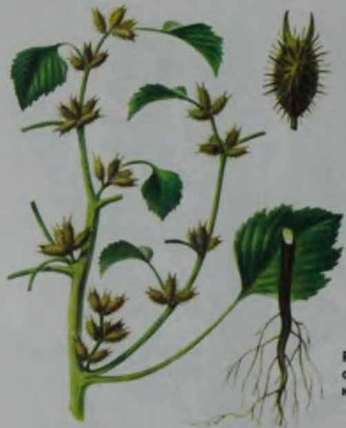
Рис. 129. Дурнушник обыкновенный – кадімгі сарысою.