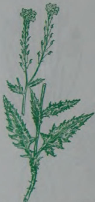
Рис. 137. Свербига восточная – шығыс майракебіс.