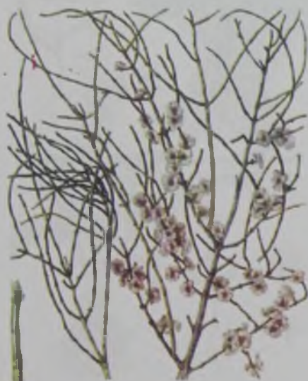
Рис. 64. Саксаул безлистный (черный) – қара сексеуіл .