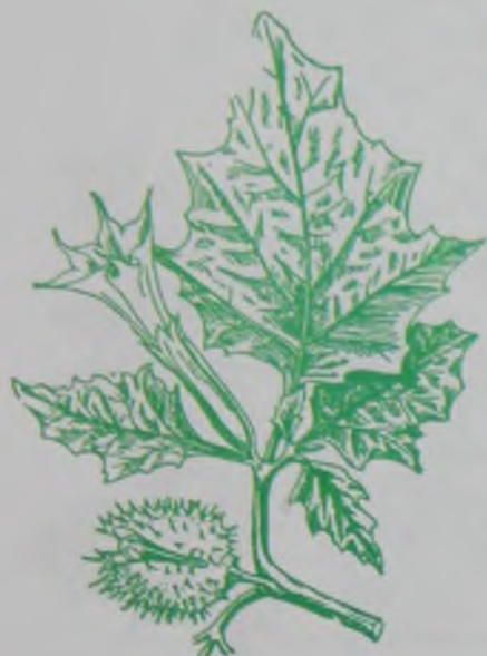
Рис. 142. Дурман обыкновенный – нағыз сасық меңдуана.