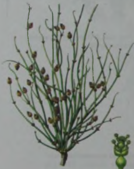
Рис. 104. Хвойник окаймленный – жиекті қылша.