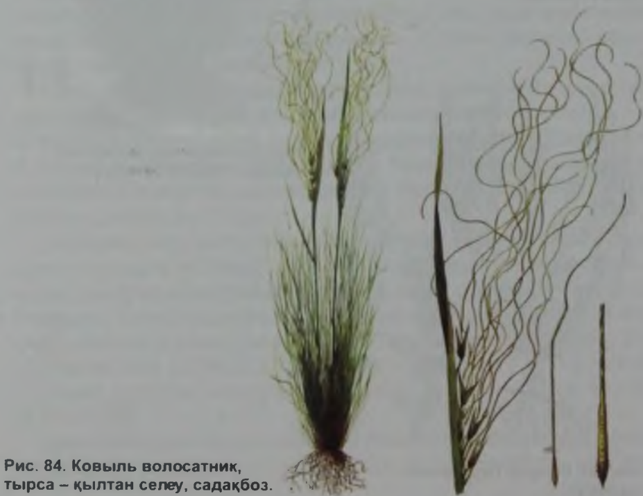
Рис. 84. Ковыль волосатик, тырса – қылтаң селеу, садақбоз.