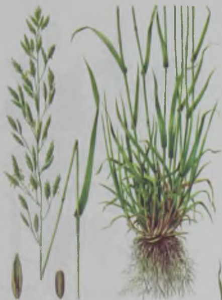
Рис. 48. Овсяница луговая – су бетеге.