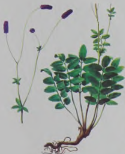
Рис. 90. Крoвохлебкa лекарственная – дарі шелна.