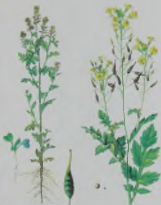
Рис. 28. Горчица белая – ақ қыж (қыша).