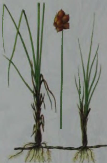
Рис. 103. Осока вздутая – үрмежеміс, қияқөлең, раң..