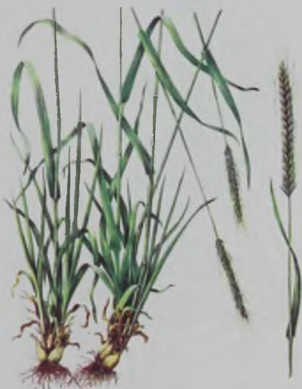
Рис. 100. Ячмень луковичный – жаман арпа.