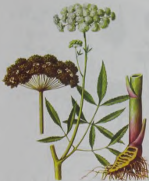
Рис. 127. Вех ядовитый – кадімгі утамыр.