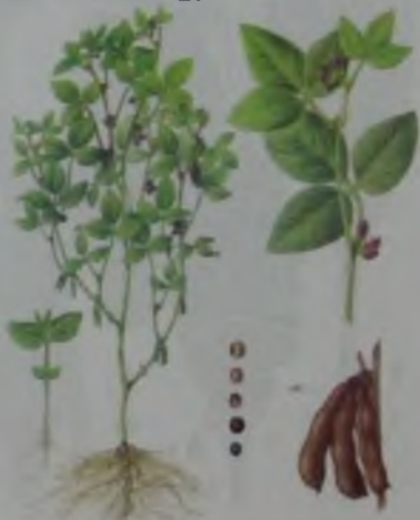
Рис. 13. Соя.