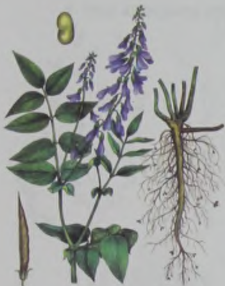
Рис. 55. Козлятник восточный – шығыстың ешкі шөбі.