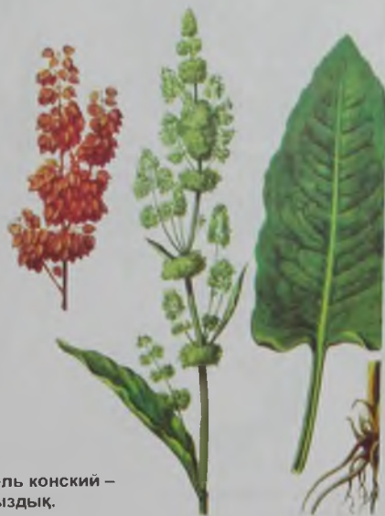
Рис. 86. Шавель конский – атқұлақ қымыздық.