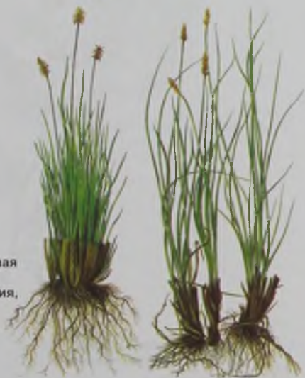
Рис. 96. Кобрезия волосолистная и Смирнова – доңызсырт (күйгенбас) кобрезия, Смирнов к.