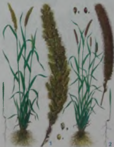
Рис. 32. Чумиза (1), могар (қонақ).