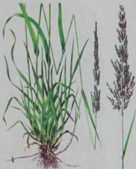
Рис. 85. Полевица белая - ақ суоты.