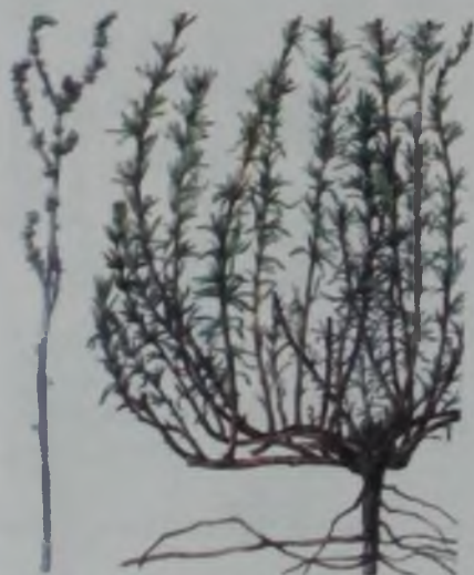
Рис. 59. Прутняк простертый – изек.