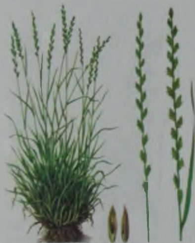
Рис. 45. Райграс пастбищный – көп жылдық бидайық.