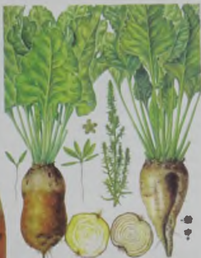
Рис. 75. Свекла сахарная и кормовая – қызылша.